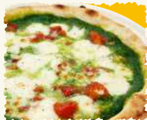
スピナーチョコピザ 税込¥1,566 (本体価格 ¥1,450)