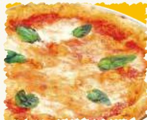
マルゲリータ 税込¥1,350 (本体価格 ¥1,250)