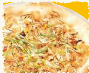
ねぎとんピザ 税込¥1,836 (本体価格 ¥1,700)