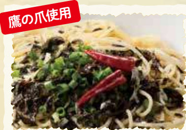
鷹の爪使用 岩のリクリームソース 税込¥540 (本体価格 ¥500)

ミートソース アサリのバジルバターソース トマトとバジルのオイルソース 各税込¥540 (本体価格 ¥500)