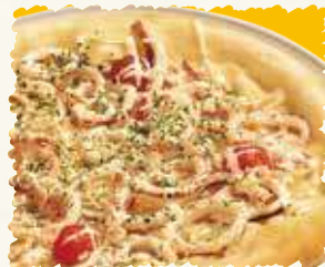
イカピザ 税込¥1,728 (本体価格 ¥1,600)