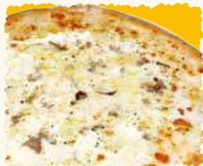
チーズピザ 税込¥1,728 (本体価格 ¥1,600)